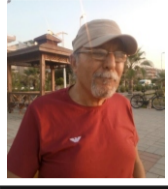
HAFIZ AĞA'NIN ATI -2-